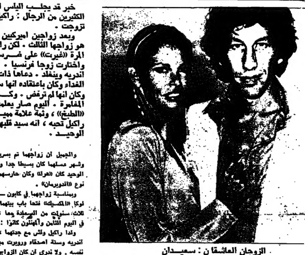
الزوجان العاشقان : سعيدان

هذا الكوميدي الطريف .. وهكذا ابصر الزوجان الى «سينار» ، ليعودا بغير الى هوليوود .. وهوليوود اكتشفت بغير طبيعة «وينفيلد» الطيبة وقباحتها الجيدة. وحين وصوله الى هوليوود تاملت اللسن اخبرا كثيرة عنه : «لقد افترقنا» بيمه اندريه كومينا موسيقية لراكيل بالاشتراك مع سينترا . التبرينات ستجري في اب . والعرض في ايلوك . كما بيمه فيلدين لها . تجري احداث ادهما في فرنسا . وستكون حلما مناسبة لحسرة يعود فيها الى وقته بعد ثلاث سنوات في الولايات المتحدة . هل تغير وينفيلد ؟ ليست هذه قضية ؟ اندريه مدهول ومرسور في ان بزواجه . حياته تجري بعكس السيناريو ، وكان هو قرر انه ان يؤدي خدمته ، وان يتزوج وان يوافق . انه الان يتبعها لان يكون تريا . وينفيلد) يملك الموهبة . وتعلم ان يعمل ، ينقل راكيل . لكنه اليوم بدأ وكلمه عليها الكسل الذي كان هو واحد من رسله الكبار . انها الاولى لها امرأة . وهو يتلم حين يتفكر ما كانت تقمه راكيل قبل اقله بها . وربما ذلك يعود الى تجاربه في الصحافة التي علمته ان يشكها القتمه عن الوجوه الاسطورية . بالنسبة اليه ، راكيل هي الجمال ، هي الكلمة القوية والمرح الحقيقي والشجاعة الشرسة والحب دائما .